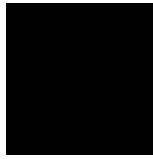
Figura 1 – Exemplo de figura com sua fonte