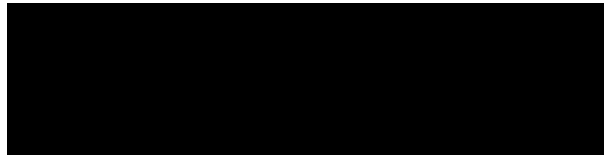
Figura 2 – Exemplo de fonte com sua figura