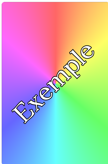
FIGURE 2 – \drawcardsverso[trame=false,contentsFontSize=40]{Exemple}

Pour avoir le bon alignement, il est recommandé de placer les commandes dans un environnement \begin{center}...\end{center} .